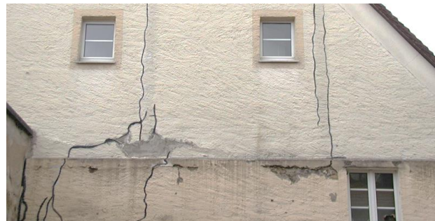
(Geothermie-geschädigtes Haus in Staufen)